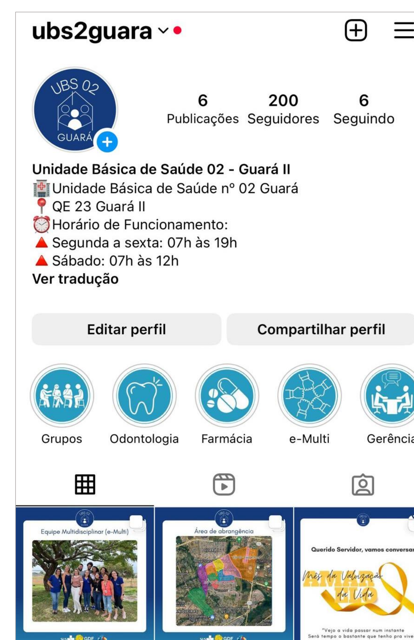
Figura 2 – Divulgação do perfil digital por meio de cartazes na Unidade Básica de Saúde 02 Guará, DF.

Figura 1 – Perfil digital referente à Unidade Básica de Saúde 02 Guará, DF.